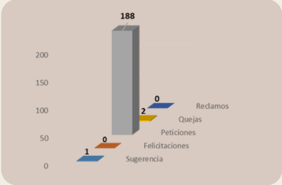
FUENTE. SCL – FO – 001 FORMATO ATENCIÓN SFPQR RECIBIDAS EN EL MES DE NOVIEMBRE DE 2024