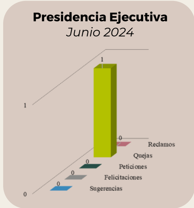
FUENTE: SCL – FO – 001 FORMATO ATENCIÓN SFPQR RECIBIDAS EN EL MES DE JUNIO DE 2024

☀ La Secretaría General - Jurídico y de Registros Públicos recibió 183 peticiones de manera directa y 4 por medio del sistema SFPQR. También recibió 1 reclamo.